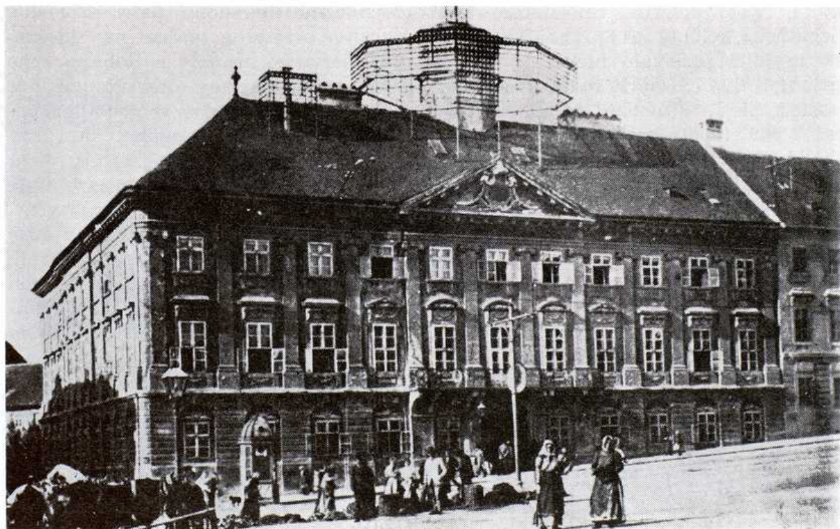
Wichterlov palác konc. 19. stor. na námestí SNP, dnešná hlavná pošta. AMB. Foto T. Ševčíková