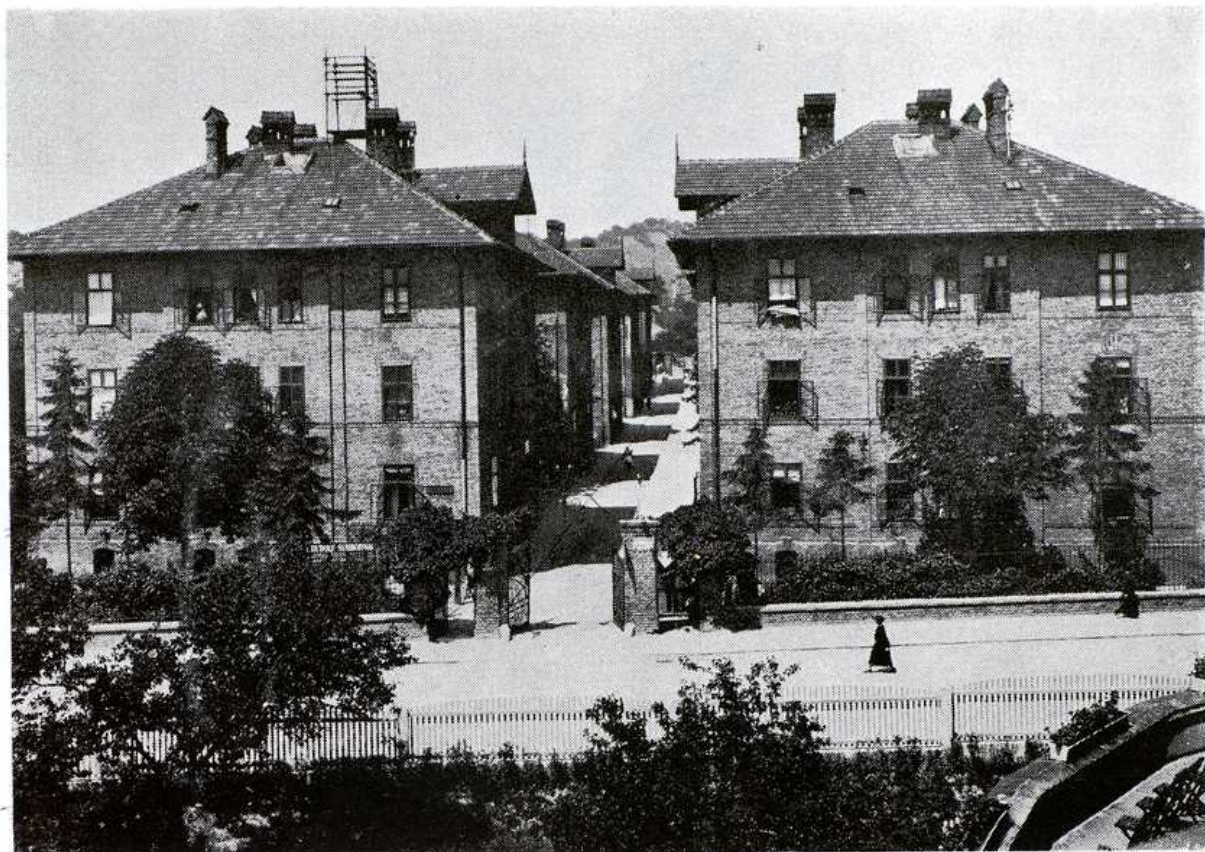
Karpatská ulica, desať mestských domov postavených zač. 20. stor. AMB