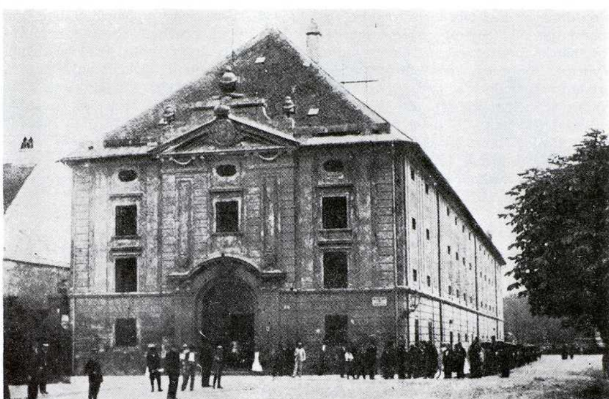
Mestská sýpka na mieste dnešnej Reduty na zač. 20. stor. AMB. Foto T. Ševčíková