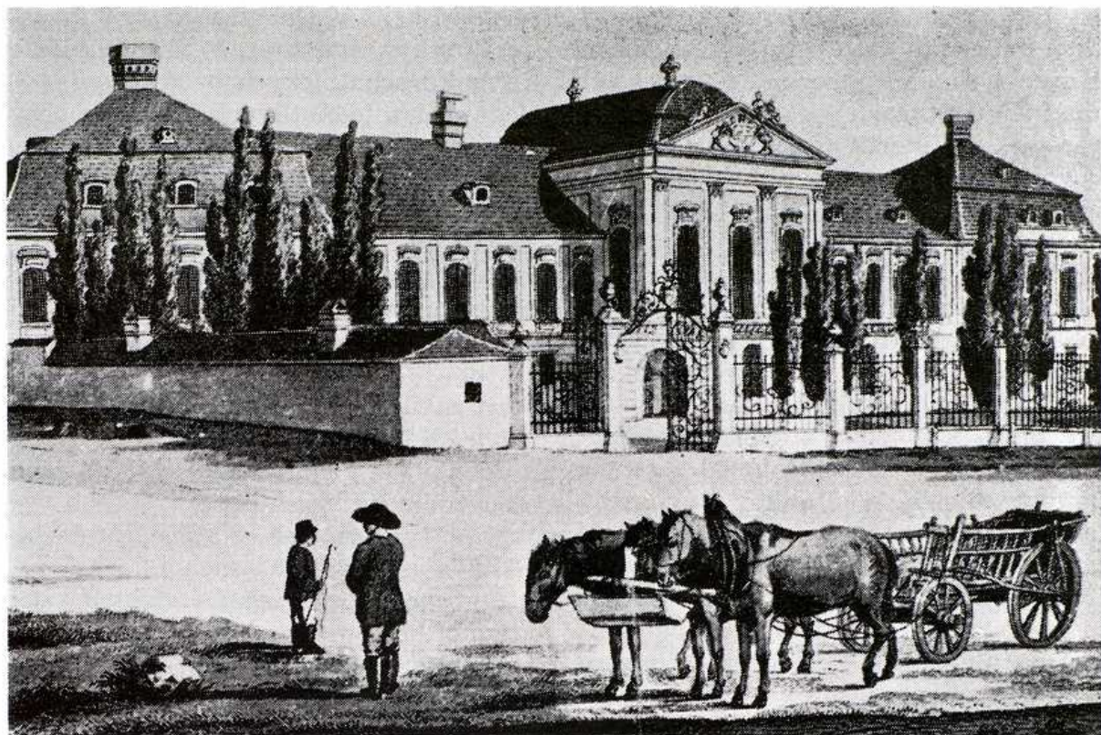
Grassalkovičov palác, dnešný Dom pionierov a mládeže v Bratislave. Podľa dobového zobrazenia z 18. stor.