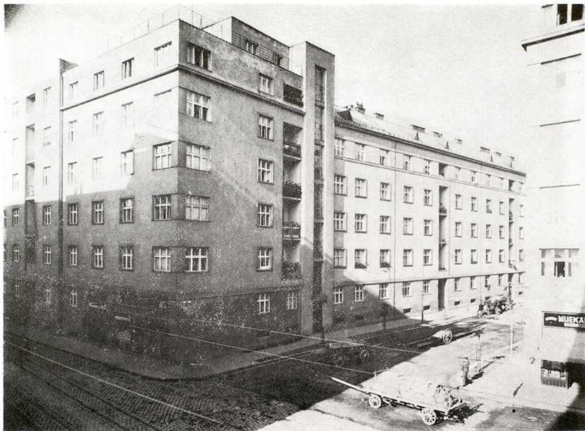
Špitálska ulica, policajné obytné domy postavené v 30. rokoch 20. stor. AMB

najväčší štandard dosiahli domy Ludovej štvrte postavenej koncom tridsiatych a začiatkom štyridsiatych rokov 20. stor. na Slovanoch, najmä pre početnosť priestorov. Obytná časť sa skladala z prízemnia, kde bola situovaná obývačka, kuchyňa a detská izba, komora a WC, a z podlažia, kde boli manželská a detská spálňa a kúpeľňa. Pivnicu a podkrovia bolo možné využiť rôznym spôsobom: od dielni, sušiarňi po sklady a pod. Domy, situované v radovej zástavbe, boli rozmiestnené v šachovnicovo sa pretínajúcich uliciach okolo štvorcového námestia. S ulicou ich spájali predzáhradky a so susedným blokom dvory so zeleňou. Situovanie a mnohofunkčnosť priestorov spôsobili, že tieto domy vo vzornej údržbe prežili dodnes. Ich prototyp na základe ďalšieho vývinu sa stal po r. 1950 vzorom pre