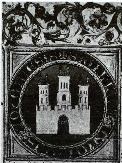
Bratislavský znak z erbovej listiny kráľa Žigmunda z r. 1436. Archív mesta Bratislavy. Repro H. Bakaljarová

Mestské či dokonca veľkomestské prostredie stálo ešte v nedávnej minulosti akoby „za hranicami“ záujmu národopisnej vedy. V podmienkach historického a spoločenského vývinu Slovenska zdal sa takýto prístup svojím spôsobom logický. Väčšina obyvateľstva žila na vidieku a zaoberala sa najmä poľnohospodárstvom a chovom dobytka. Roľníctvo i svojou početnosťou predstavovalo spoločensky a kultúrne najstabilizovanejšiu vrstvu nášho národa.