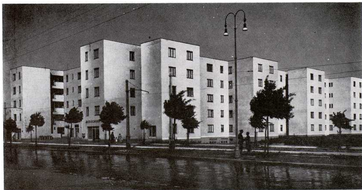
Domy na Novej dobe z r. 1934—40. AMB