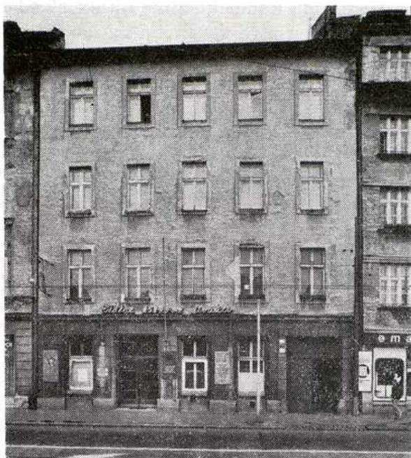
Budova robotníckeho domu Napred, dnešné Štátne bábkové divadlo.

vého muriva a komínov, čo spolu s úverom viedlo k zlacneniu stavby.) Napriek štátnym dotáciám a ochote viacerých pokrokových bratislavských architektov mesto problematiku nevedelo koncepcne zvládnuť. Dnes je ťažké zistiť, či sa tak stalo na základe korupcie a nedostatočnej odbornosti mestského stavebného odboru, či na základe politickej nejednotnosti predstaviteľov mesta, ktorí nemali predstavu o perspektívnom vývine moderného mesta a životných potrebách jeho pracujúceho obyvateľstva. Napriek tomuto chaosu koncom dvadsiatych a začiatkom tridsiatych rokov prijalo niekoľko vážnych uznesení, ktoré sa hneď začali plniť. Medzi najdôležitejšie patria: začala sa realizovať výstavba provizórnych bytov na Jégého ulici, ktoré boli určené pre najchudobnejšie rodiny. Jednoizbové byty mali spoločné vchody (vždy dva byty jeden vchod). Mali zavedenú elektrinu, kanalizáciu a vodovod. Ďalším bolo uznesenie, že každá firma, ktorá v strede mesta búra staré byty, je