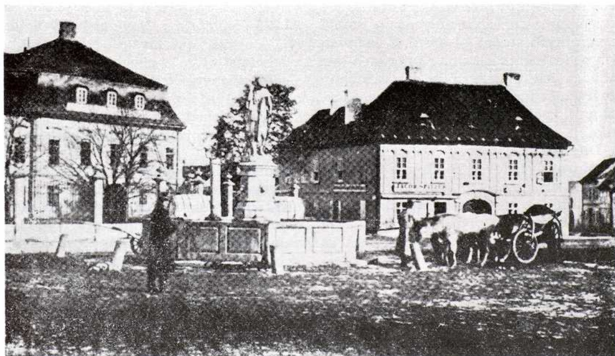
Studňa pred Grassalkovičovým palácom, tzv. studňa chytačky bĺch podľa pohybu klasicistickej sochy. Dobová pohľadnica zo zač. 20. stor.